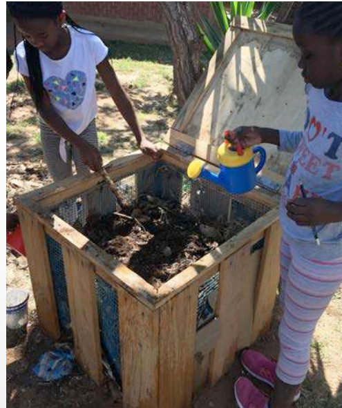
Les usages de l'eau