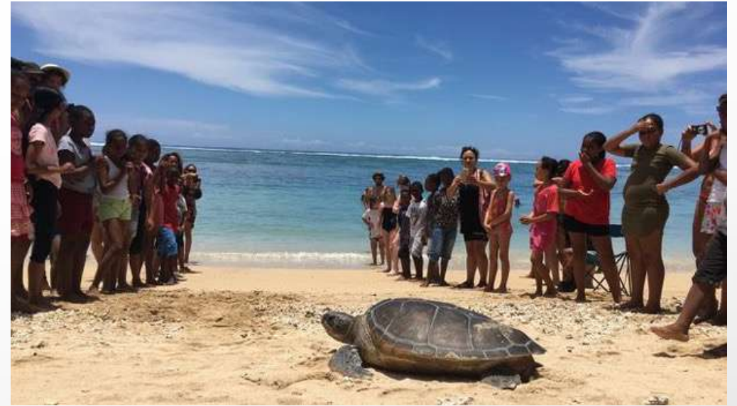
Kélonia et les tortues marines