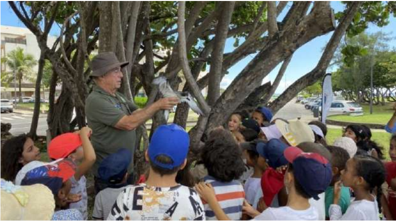
La SEOR et les pétrels