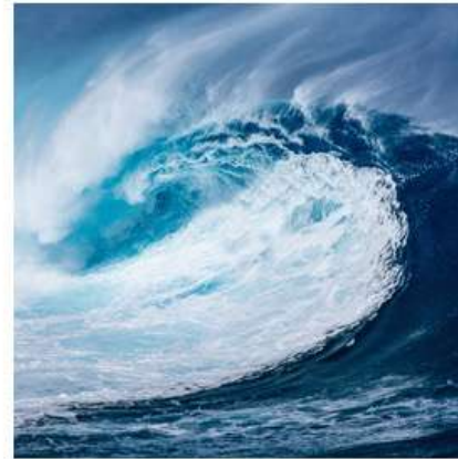
HOULE ET MARÉE