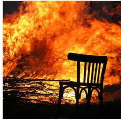
FEUX DE FORÊT & DE VÉGÉTATION