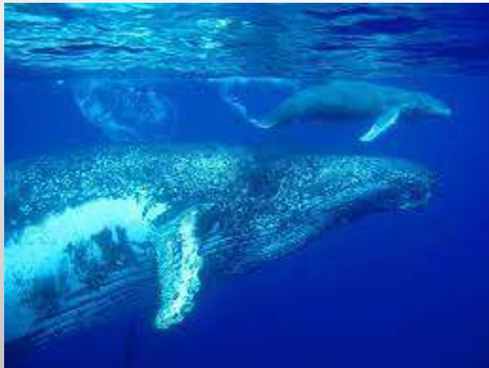
Globice et les baleines à bosse