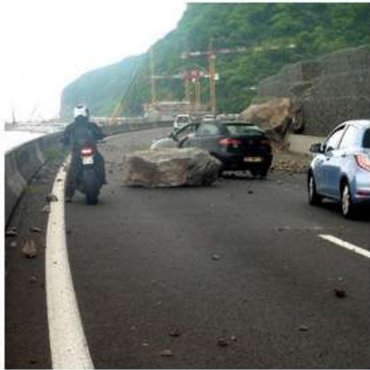
MOUVEMENT DE TERRAIN