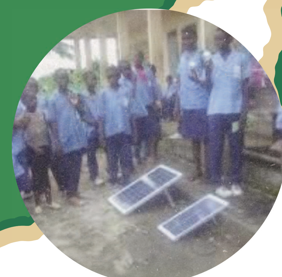
LYCÉE PK21 DE DOULA, 2020