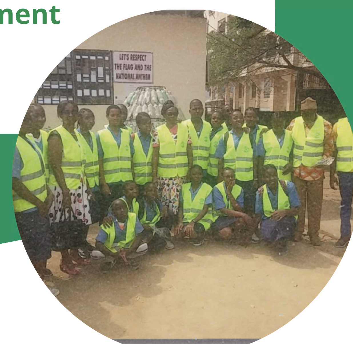
LYCÉE BILINGUE DE LOGPOM 2, DOUALA, 2019

Dans le cadre de la mise en œuvre du Programme d'Action global de l'Unesco sur l'EDD au Cameroun, le Réseau africain pour le développement durable (RAEDD) s'est engagé en 2014 à renforcer les capacités de cinq mille éducateurs et formateurs sur l'EDD d'ici à 2019 et à accompagner les écoles dans la démarche d'éducation à l'environnement, au développement durable et au changement climatique.